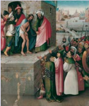
Ecce Homo, Jheronimus Bosch eind 15e eeuw

Zie de mens... met deze woorden stelt Pilatus de gezeselde en met doornen gekroonde Jezus aan het volk voor, in het lijdensevangelie volgens Johannes hoofdstuk 19. Zie de Mens, Ecce Homo, onderdeel van de Kruisweg en een geliefd thema in de kunst.